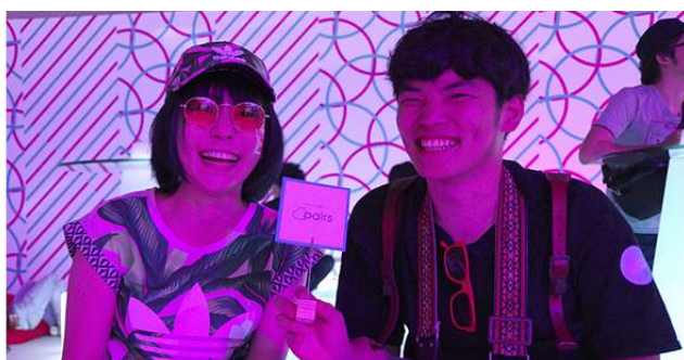
『スペシャルラウンジpowered by uP!!! / Pairs』の会場と来場者の様子

本ラウンジは、音楽の趣味が合うとPairsでマッチングする（お互いに興味を持ち、サービス上で「いいね！」を送り合うこと）確率が平均の約2倍になる、という独自調査結果をもとに、「音楽」をきっかけに始まる恋愛・結婚をPairsとして応援したいという想いから、企画・開催したものです。